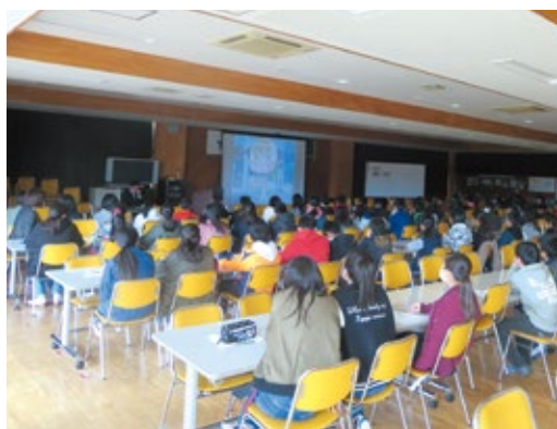
租税教室(三輪小学校)