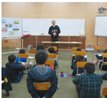
租税教室(秋月小学校)