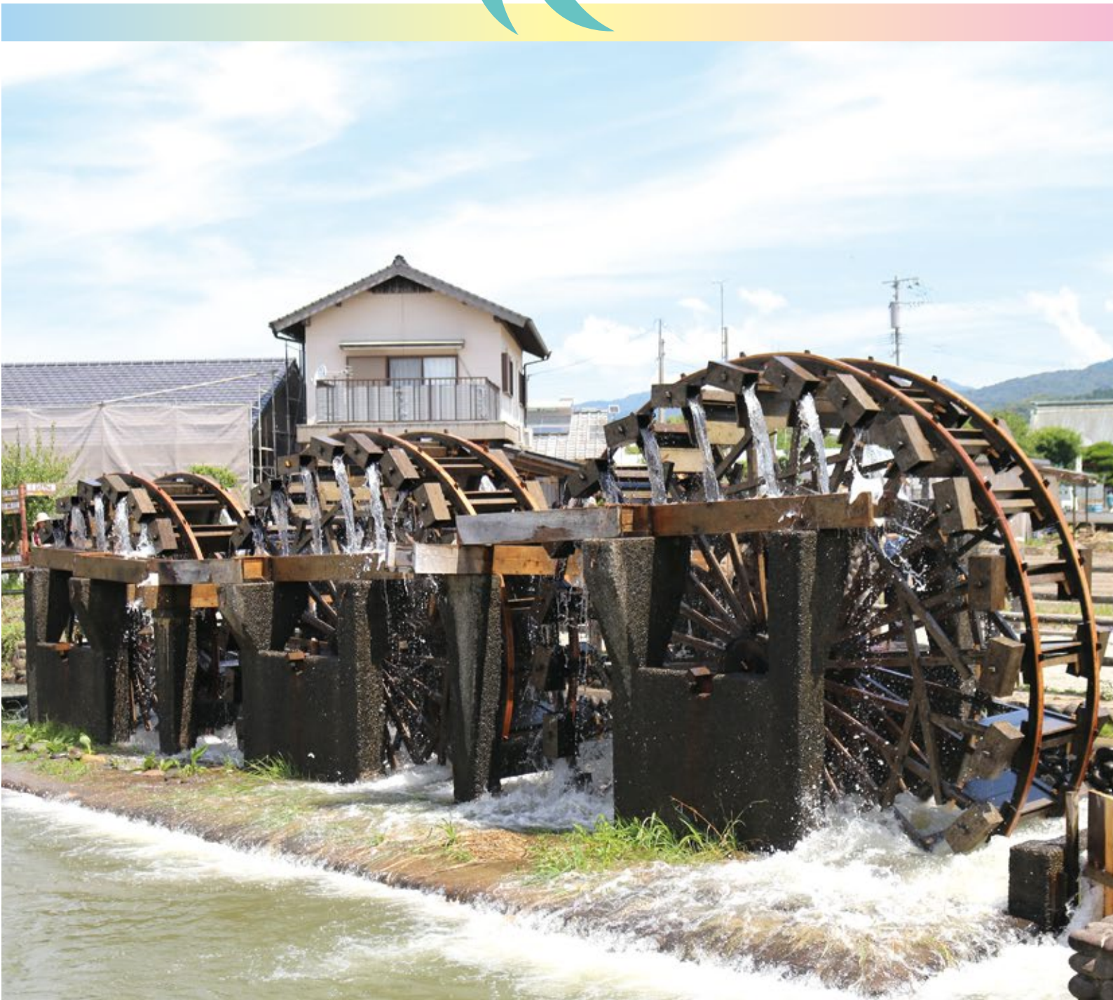
三連水車風景