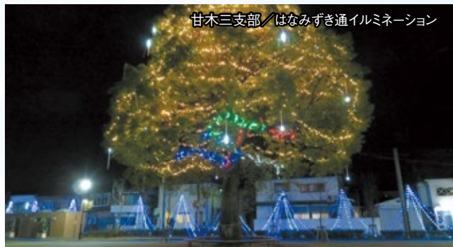
甘木三支部／はなみぎぎ通イルミネーション