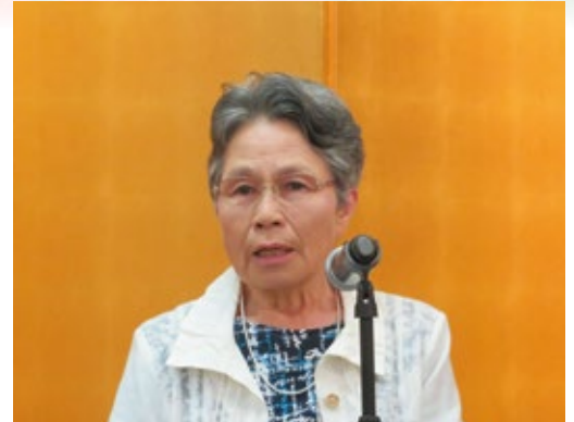
第7回定時総会であいさつする女性部会長

さて、これから私の任期の終わりまでに、いったい何が出来るでしょう。租税教室は学童保育所2ヶ所、6年生対象の税金教室は3校、最後まで悔いのないようがんばっていきます。会員の若返りと少しでも多くの参加を心よりお待ちしております。