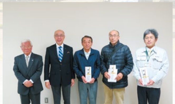
仮設住宅寄贈品目録贈呈式

また、被災された方々が入居している3ヶ所の仮設住宅集会所に、甘木ロータリクラブ、甘木朝倉間税会、甘木朝倉法人会の三団体共同で、パソコン、プリンターを贈呈しました。