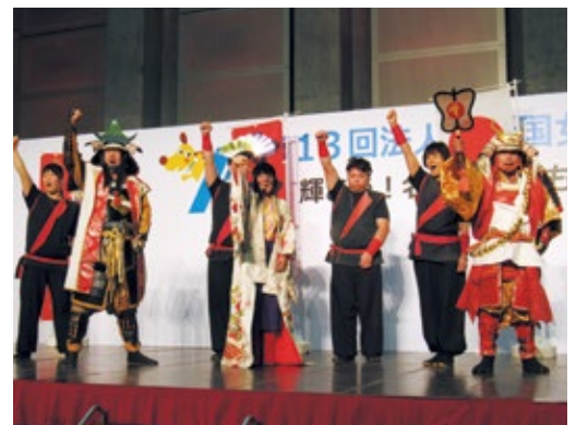
第13回全法連女性フォーラム 山梨大会