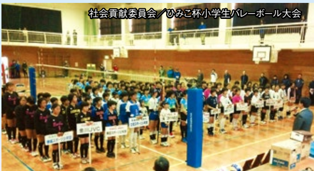
社会貢献委員会／ひみこ杯小学生バレーボール大会