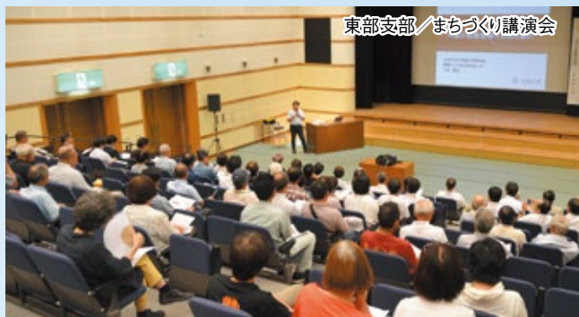
東部支部／まちづくり講演会