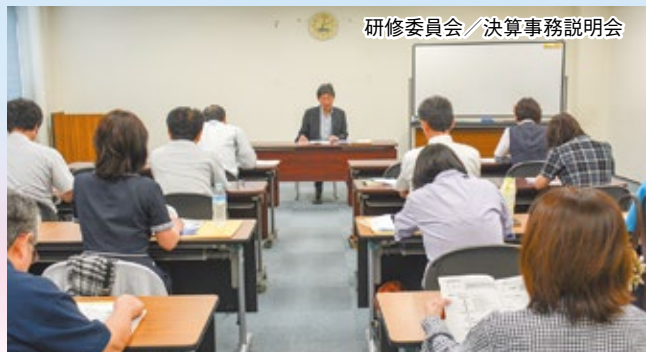
研修委員会／決算事務説明会