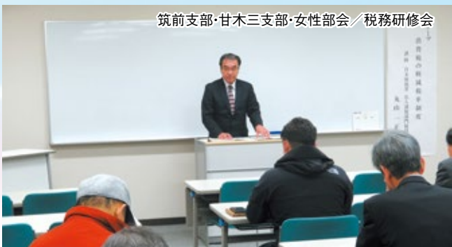
筑前支部・甘木三支部・女性部会／税務研修会