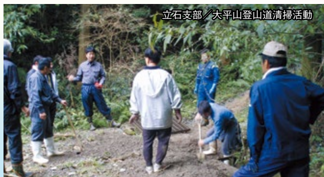
立石支部／大平山登山道清掃活動