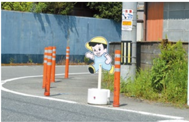
飛び出し人形の設置

平成30年度は九州北部豪雨で流されたものの補充、看板老朽化による交換、新たに信号機のない危険交差点への設置等を予定しています。