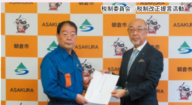
税制委員会／税制改正提言活動