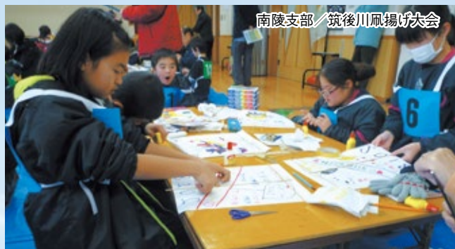
南陵支部／筑後川凧揚げ大会