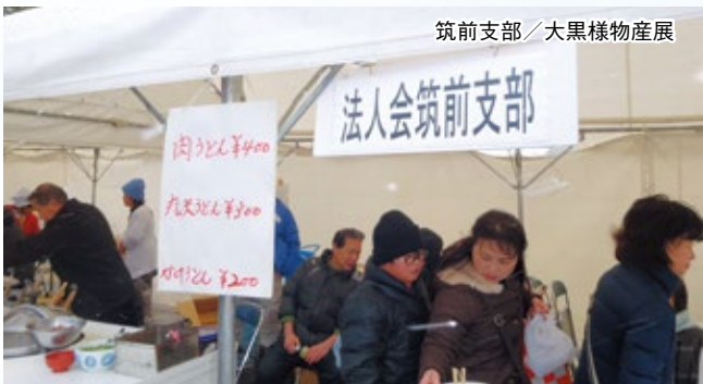
筑前支部／大黒様物産展