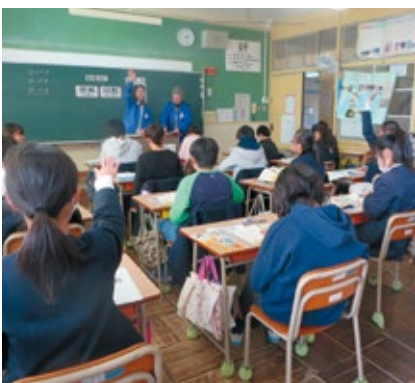
租税教室(金川小学校)