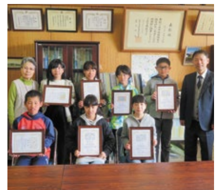
絵はがきコンクール表彰式