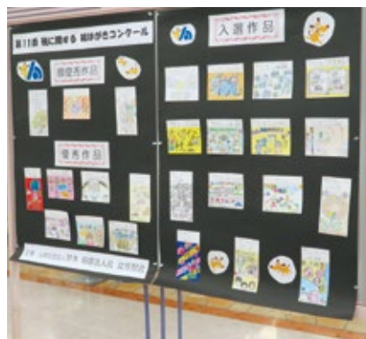
絵はがきコンクール入賞作品展示風景