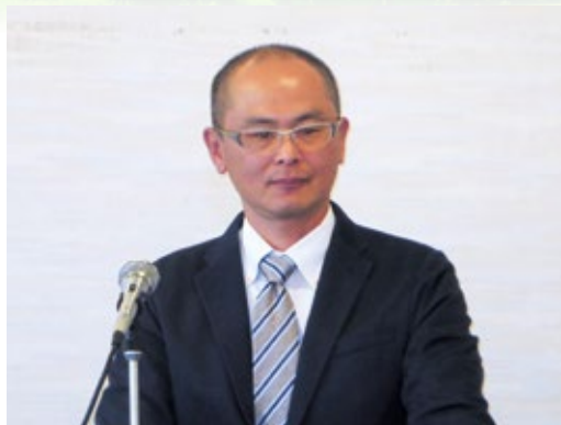
青年部会第7回定時総会であいさつする青年部会長

昨年7月に発生した九州北部豪雨から一年が経ちましたが、その間、西日本豪雨等日本各地で様々な豪雨災害が発生しました。多くの被災された方々におかれましては心よりお見舞い申し上げます。一日も早いご再建をお祈り申し上げます。