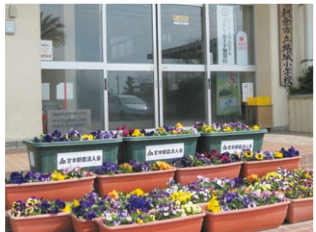
蟻城小学校にプランター贈呈

支部活動の一環として、街の美観を保つため、保育所、小・中学校、交番、コミュニティーセンター等公共施設に花のプランターを設置しています。