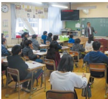
租税教室(朝倉東小学校)