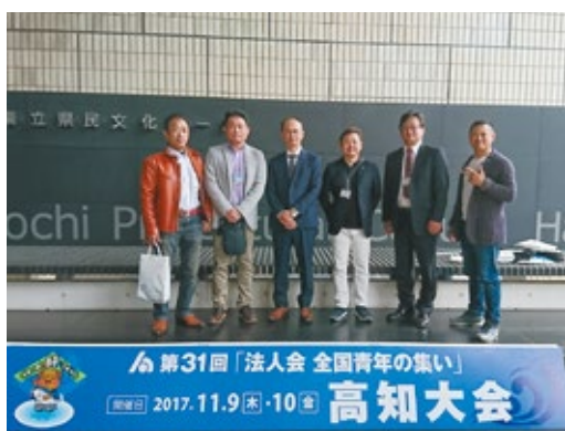
第31回全国青年の集い高知大会

以上、青年部会はこの三本柱で事業を行いますので、皆様のご協力をよろしくお願いいたします。