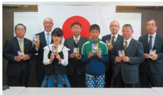
防犯ブザーを子どもたちへ贈呈

子どもたちに対する犯罪防止のために少しでも役立つことを願って、今後もこの活動を継続していきます。