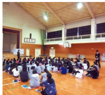
租税教室(立石小学校)